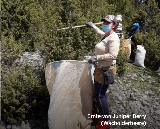
Ernte von Juniper Berry (Wacholderbeere)