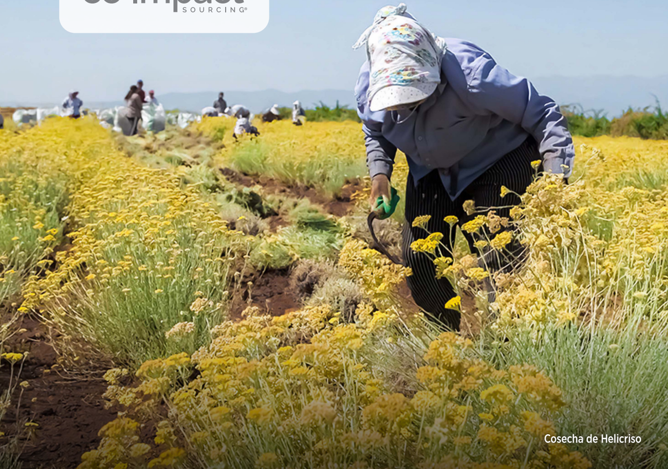
Cosecha de Helicriso