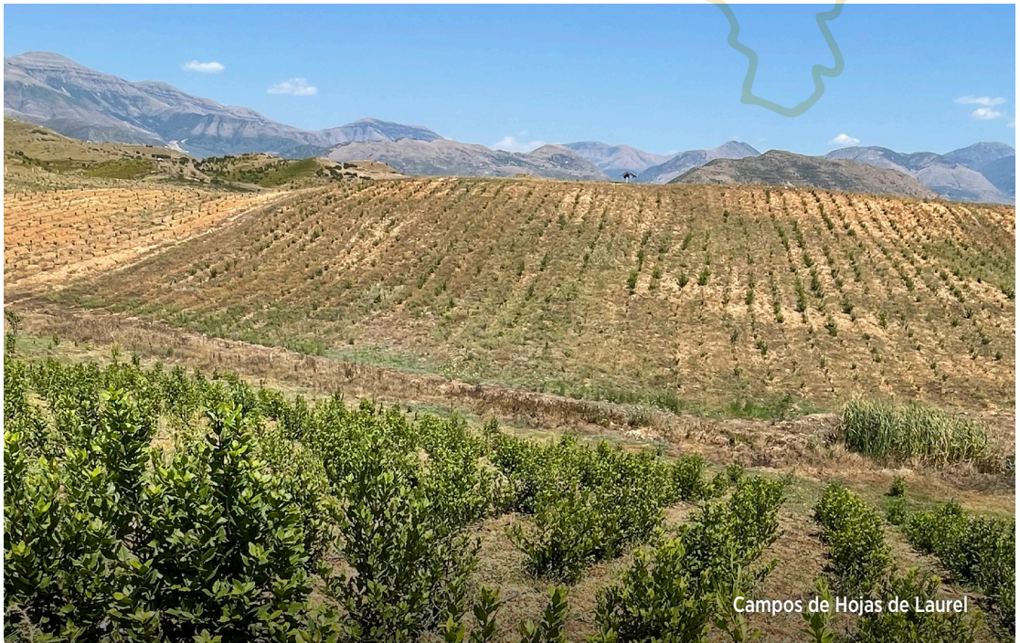
Campos de Hojas de Laurel